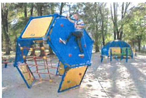
NIVEA PLAC ZABAW0604 1.jpg ~695 KB

Stosownie do art. 4 ust. 2 pkt. 1 Ustawy o petycjach (Dz.U.2018.870 t.j. z dnia 2018.05.10) - osobą reprezentującą Podmiot wnoszący petycję - jest Prezes Zarządu Adam Szulc Stosownie do art. 4 ust. 2 pkt. 5 ww. Ustawy - petycja niniejsza została złożona za pomocą środków komunikacji elektronicznej - a wskazanym zwrotnym adresem poczty elektronicznej jest: rodzinnemiejsca@samorzad.pl Adresatem Petycji - jest Organ ujawniony w komparycji. Kierownik Jednostki Samorządu Terytorialnego (dalej JST) - w rozumieniu art. 33 ust. 3 Ustawy o samorządzie gminnym (Dz.U.2018.994 t.j. z 2018.05.24) * - niepotrzebne skreślić